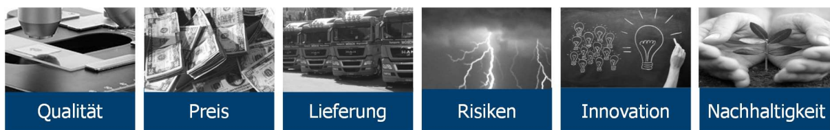
Abbildung 1: Kriterien zur Bewertung der Lieferanten

Die Lieferanten-Bewertung dient der Überwachung und der Differenzierung unterschiedlicher Qualitätsleistungen der Lieferanten.